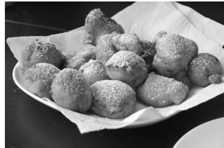
A képek illusztrációk!

A túróhoz hozzáadjuk a tojást, a citrom reszelt héját, a cukrot, vaníliás cukrot. Ezeket jól összekeverjük. A lisztet átszitáljuk, hozzáadjuk a sütőport és a túros masszával összekeverjük. Vizes kézzel vagy kanál segítségével gombócokat formálunk, és forró, bő olajban megsütjük. Maguktól szépen átfordulnak a fánkok. Papírtörlőre kiszedjük, lecsepegtetjük a felesleges olajat. A fánkokat az édes tejföllel (tejföl, vaníliás cukor, porcukor) és áfonyalekvárral tálaljuk.