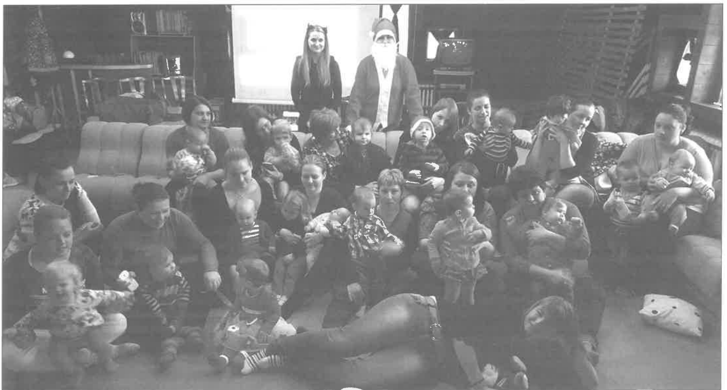
A Baba Mama Klub Mikulás-napi foglalkozása 2016. december 5.

Találkozunk 2017-ben is a könyvtárban! könyvtár dolgozói