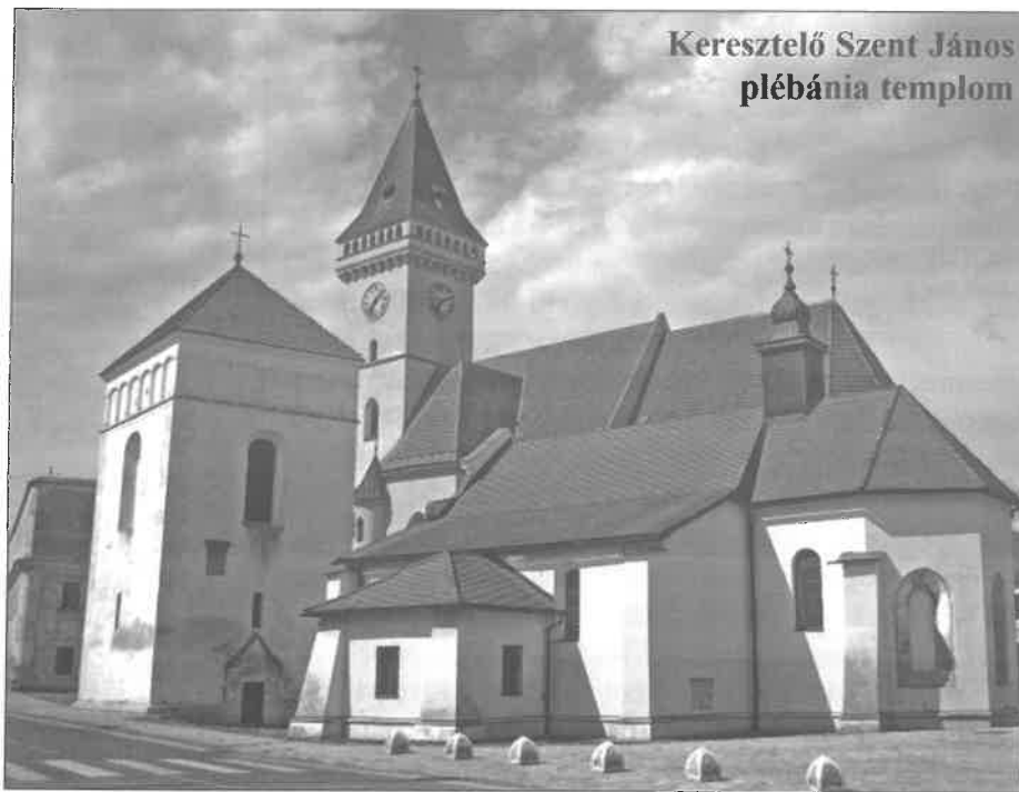
Keresztelő Szent János plébánia templom

A városkát a 12. században alapították. Virágkorát a 12. század végén és a 13. század elején élte flamand telepeseinek köszönhetően. A város a tatárjárásor elpusztult. Első írásos említése 1248-ból származik, amikor már fejlett település, királyi birtok volt. Lakói kezdetben főként mezőgazdaságból, később kézművességből éltek. Fejlődésére serkentőleg hatott, amikor 1299-ben III. András király Nagysárossal és Eperjessel együtt adományozta, vámszedési jogot, szabad bíróválasztási és ítélkezési jogot, valamint vadászati és halászati jogokat adott Kisszebennek. 1406-ban Zsigmondtól kapta további kiváltságait és szabad királyi város lett. A 15. század végére Kisszeben Kassával, Eperjessel, Bártfával és Lőcsével együtt az öt legjelentősebb felvidéki város szövetségének az ún. „Pentopolisnak” a tagja lett. A kezdeti virágzás után a hanyatlás időszaka következett. A 16. században elérte a reformáció, melyet vallási harcok követtek. A város a kuruc harcokban leégett, majd 1709-ben a lakosság több mint fele pestisjárvány áldozata lett, amely veszteséget azóta sem heverte ki. 1848-49-ben a város ifjúsága lelkesen vett részt a szabadságharcban, ezért Kossuth „hű Szebennek” nevezte. A 19. századra azonban Kisszeben lényegében a jelentéktelenebb vidéki mezővárosok szintjére süllyedt. A trianoni békeszerződésig Sáros vármegye Kisszebeni járásának székhelye volt.