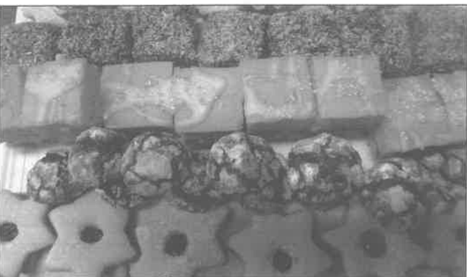
Süteménycsodák! Irigylésre méltó alkotások születtek. A bánhalmi asszonyok született cukraszok

Ünneplő kis vendég. Szépségét mindenki csodálta. Figyelmesen és fegyelmezetten hallgatta az előadásokat, majd megevett két nagyon finom süteményt.