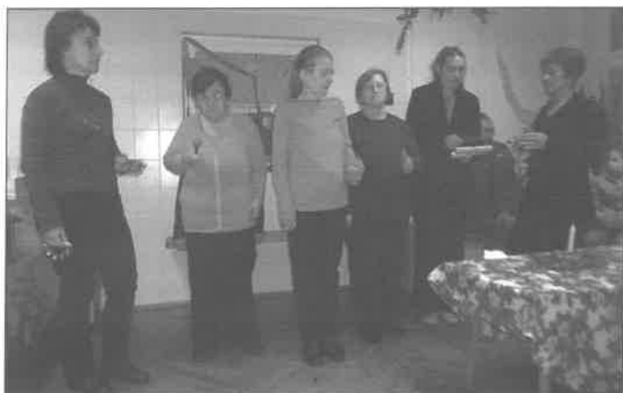
A Fenyves Otthon lakóinak előadása