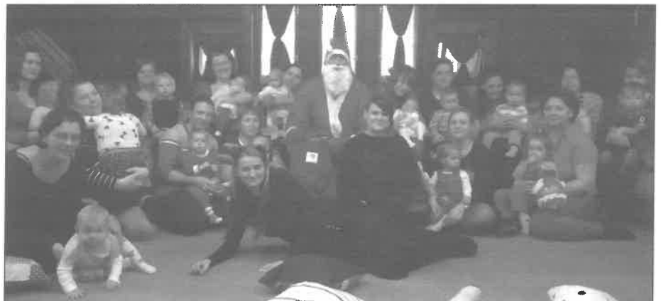
A Baba Mama Klub Mikulásnapra rendezvénye a könyvtárban

Áldott, békés karácsonyt, nagyon jó egészséget kíván minden KEDVES OLVASÓJÁNAK a Kenderesi Krónika szerkesztősége, szerkesztő bizottsága, felelős kiadója, valamint a nyomda munkatársai.