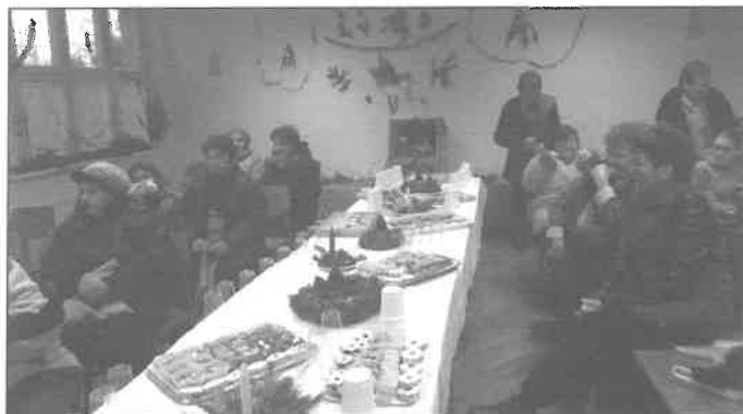
A közönség, a terített asztal mellett. Teáztak, beszélgettek, s koccintottak is a kiváló házi pálinkákkal