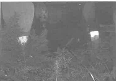
Az udvaron már ég az adventi gyertya