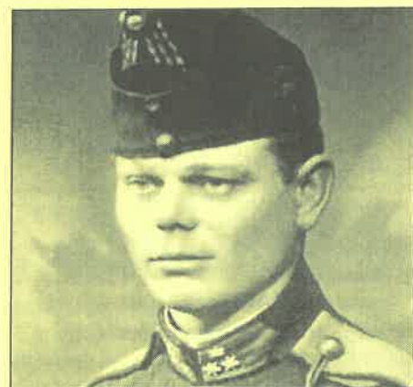
A második világháborúban hősi halált halt, NÁSZ MIKLÓS utolsó fényképe