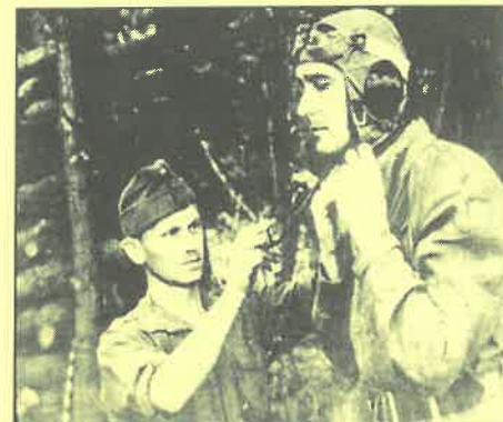
Vitéz Nagybányai Horthy István bevetésre készül