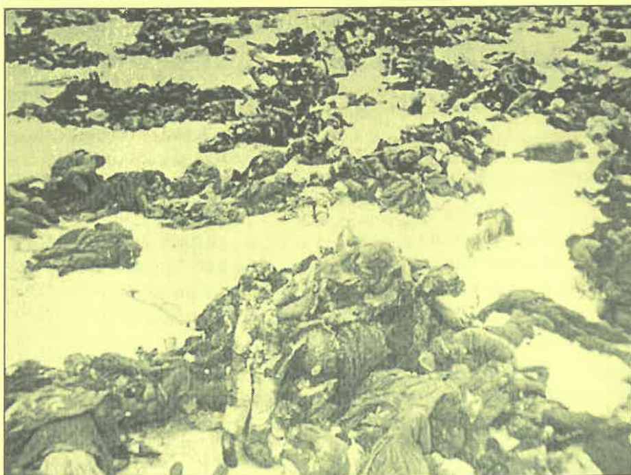
„Don kanyarban áll egy szomorú fűzfa, magyar baka halva fekszik alatta bajtársai kardjaikkal ássák a sírját odahaza magyar lányok siratják.”