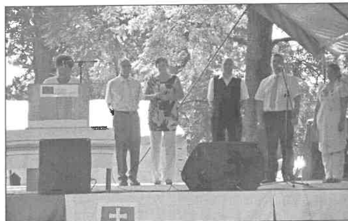
Városnapi megnyitó, testvérvárosi küldöttségek köszöntése