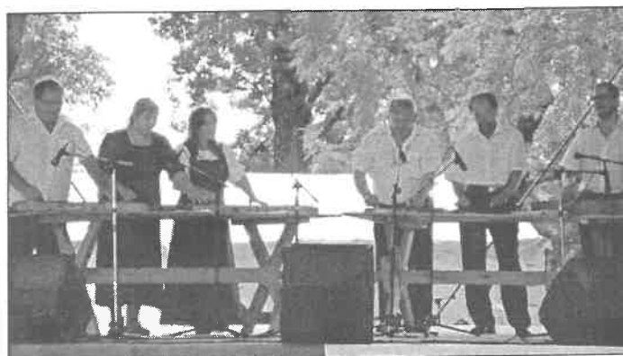
A mezőtúri Szivárvány Népzenei Egyesület műsora