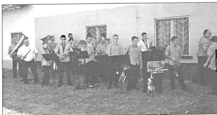
A csíkszentmártoni Poszogó Fúvószenekar