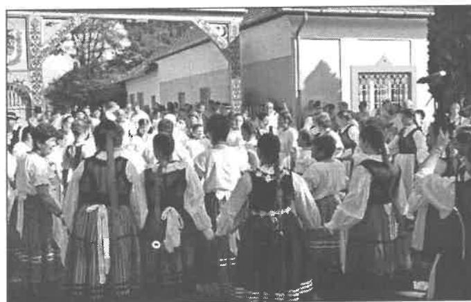
Lánykikérő a Székelykapunál