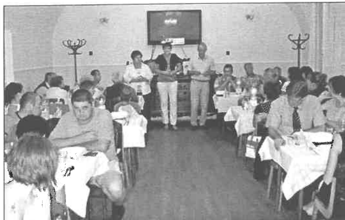
Díszvacsora a testvértelépülések fogadásának tiszteletére