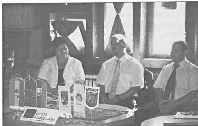
Európai Kulturális Kerekasztal beszélgetés