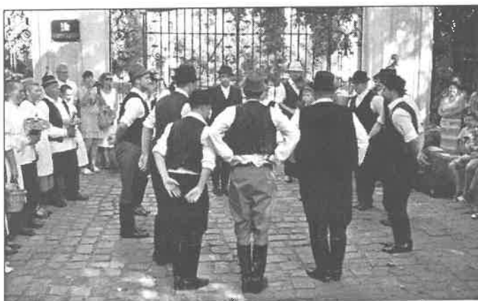
Völegénykikérő a Horthy-kastély előtt