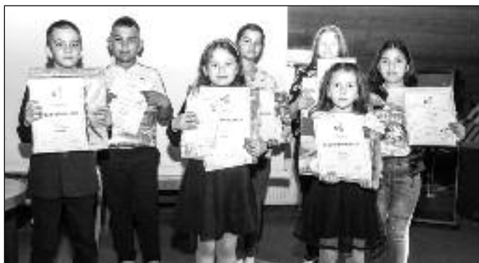
Alsó tagozatos tanulók versmondó versenye