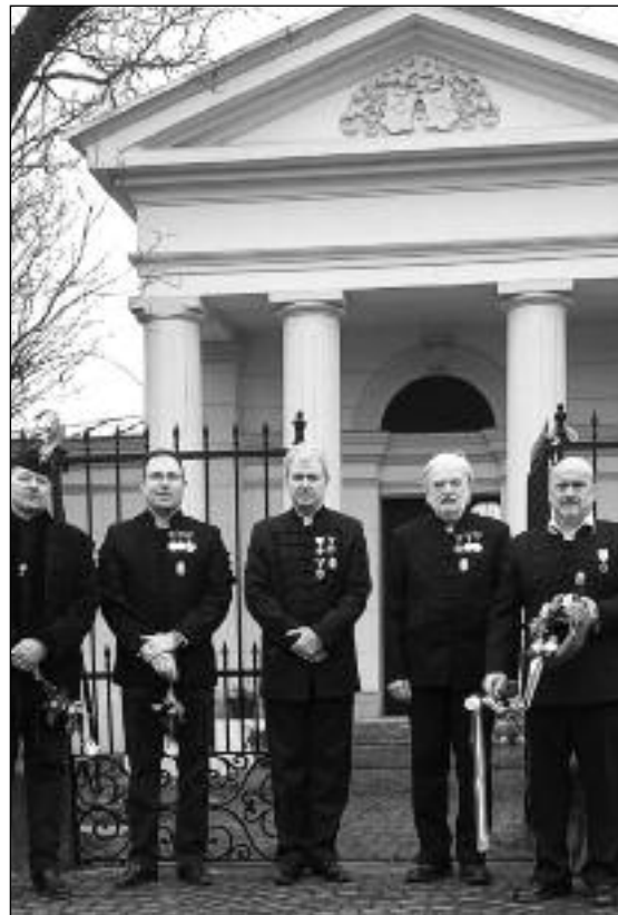
Február 7-én megemlékezést tartottunk vitéz nagybányai Horthy Miklós Kormányzó Úr halálának 64. évfordulóján.