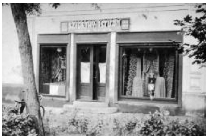
Boltunk a háború előtt