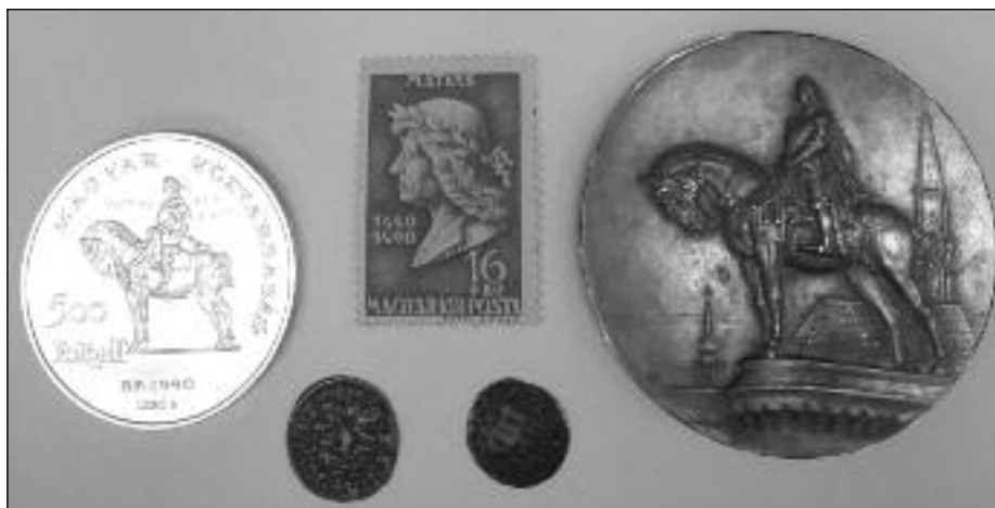
Mátyás király korabeli ezüst dénárjai, a Kolozsvári Mátyás szobor korabeli plaketten, és egy modern emlékpénz