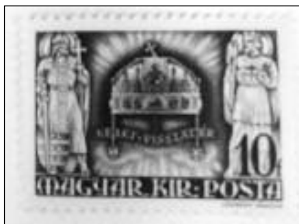
A visszatérés alkalmából a Magyar Királyi Posta által kiadott bélyeg

című regénye, és Radnóti Miklós: Ikrek hava, - ebben az évben született Al Pacino, Chuck Norris, Bruce Lee, - 1940-ben megjelent magyar filmek: Rózsafabot, Fűszer és csemege, Dankó Pista, és az első magyar dokumentumfilm Isten tenyerén címmel.