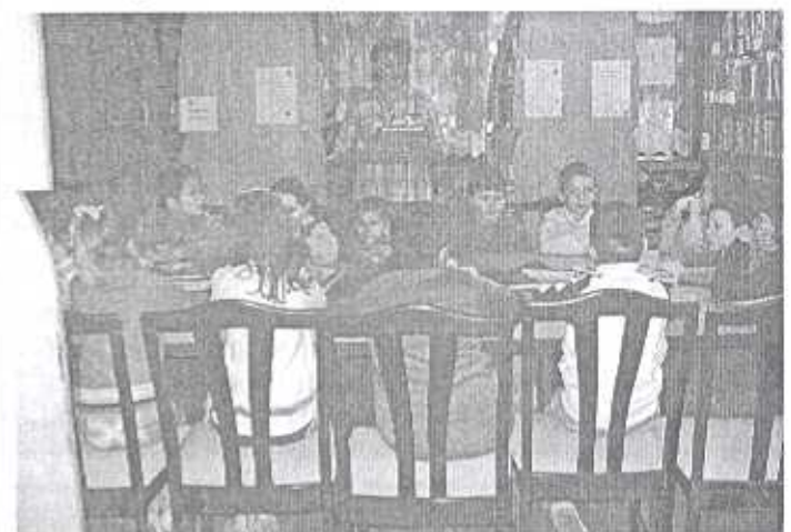
Könyvtárhasználati óra az 1. e osztályosokkal