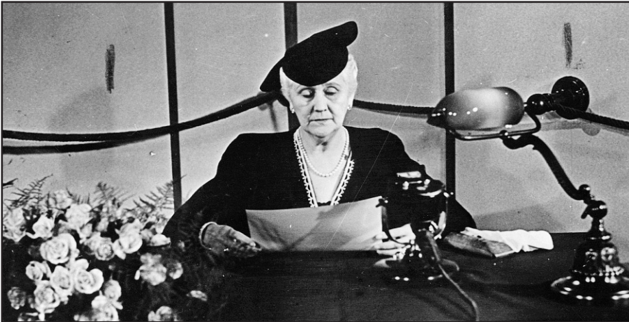
Horthy Miklósné született jósáshelyi Purgly Magdolna