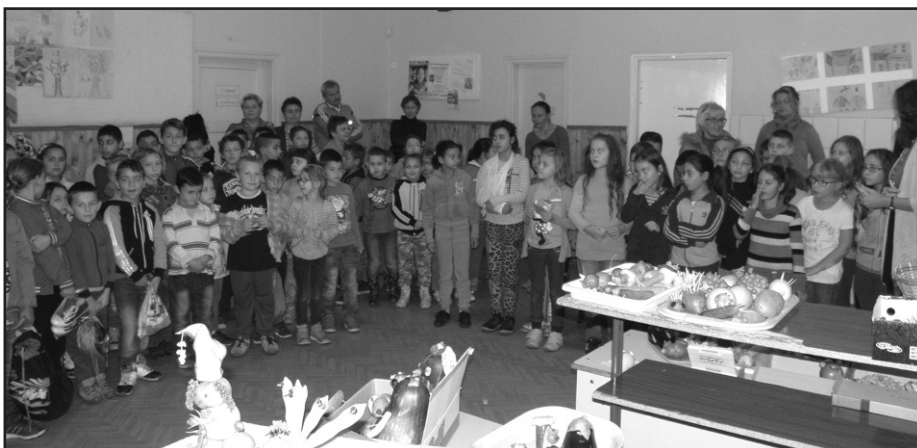
Mikor eszünk már?