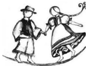
Jelentkezési lap nyári néptánc táborra