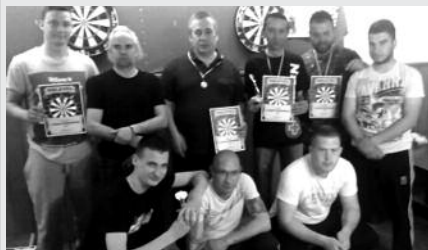
A Kenderesi Sportegyesület Darts Szakosztálya

Tisztelettel kérünk minden kedves lakost, hogy erejükhez mérten támogassák a Kenderesi Sportegyesület labdarúgó és darts szakosztályát a 2017/2018 évad kezdetének sikeres elindításában és eredményes folytatásában!