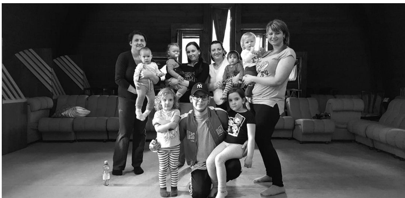
A Baba Mama Klub márciusi foglalkozásán az anyukák együtt zumbáztak a babákkal