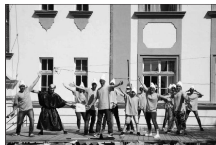
A 7.e Aprajafalváról