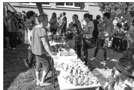
Vásárlás a szünetben

Május 31-én 70 felsős tanuló kirándult Erdőtelekre, ahol ellátogattak a katolikus templomba, az arborétumba és megtekintették a tájházat is.