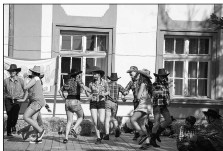
A 6. c a Vadnyugaton