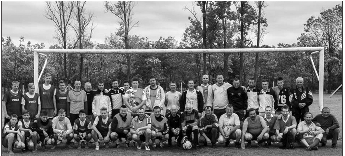
A képen a „Veteránok”, „Tapasztaltak”, „Suhancok” és a „Fiókák” csapatai láthatók.