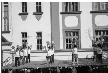
A 2.b lufis tánca