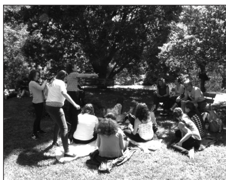
Pihenő az arborétumban