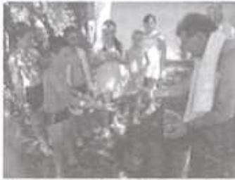
Jól esett a friss dinnye a túrkevei strandon