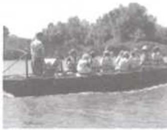
Csónakhíra a Tisza-tavon Tiszaörsönvébe