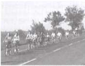
Kunhegyesről Berekfűrdőre tekerünk