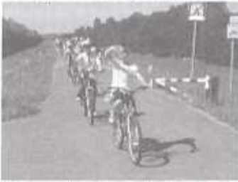
Útban a gáton Poroszló felé