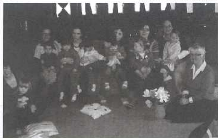
Baba-Mama Klub összejövetele 2011. március 8.