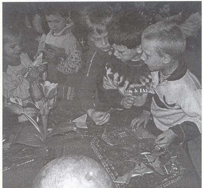
Április 22. Föld napja együtt az óvodásokkal