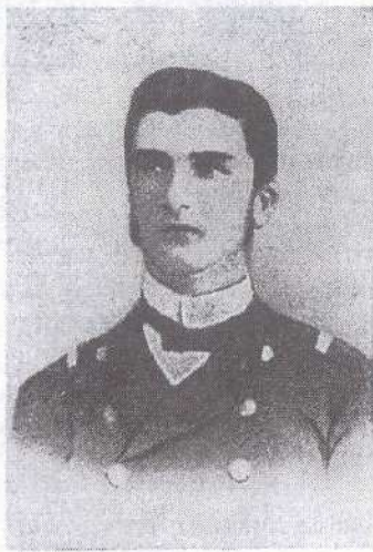
Nagybányai Horthy Miklós, mint sorhajózászlós. Kalkuttai fénykép.

Vitéz Nagybányai Horthy Miklós 1868. június 18-án született Kenderesen. Nyolc éves koráig a családi birtokon élt, elemi iskolai tanulmányait magánúton végezte szülőfalujában, majd a Debreceni Református Kollégiumban. A visszaemlékezések szerint eleven és kalandszerető gyermek volt. Emlékirataiban így ír erről: „Atyám nem sok megértést tanúsított csínyteitem iránt sem, pedig élénk képzeletem és kalandvágyam el-elcsábított. Így történt aztán, hogy elnéző édesanyám vonakodása ellenére már nyolc éves koromban elszakadtam a meleg családi körből. Debrecenbe kerültem két bátyámmal közös szállás- ra”.