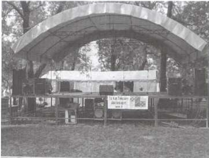
A megújult színpad

A 2007. évi Városnap rendezvényét sikerült szintén LEADER forrásból színvonalasabbá tenni, ugyanakkor lehetőség nyílt a szabadtéri színpad teljes felújítására és hangosító eszközök beszerzésére is.