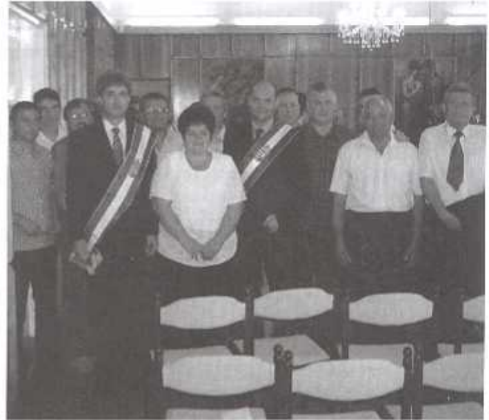
A kenderesi városvezetés és a csíkszentmártoni delegáció

A Horthy-liget rehabilitációját szolgálta a liget térvilágításának, valamint az emlékmű díszvilágításának megvalósítása. A ligetben játszótér kialakítására is sor került a Kenderesi Gyermekek- és Ifjúsági Közalapítvány, valamint a Területi Gondozási Központ támogatásával. A Liget további fejlesztését támogatja az a nyertes Európai Unió pályázat, amelynek keretében 2009-ben a sétautak térkövezése, streetball pálya készítése, egy pár mini focikapu kihelyezése, a játszótér bővítése, padok, hulladékgyűjtő edények kihelyezése fog megvalósulni. Automata diszkút telepítése fog történni a Rákóczi Ferenc és a Toldi Miklós út sarkán, valamint padok, hulladékgyűjtő edények kihelyezésére kerül sor a Rákóczi Ferenc és a Szövetkezeti utak mentén. A ligetben tervezett fejlesztések megvalósulásával jelentősen megerősödik a liget közösségi tér funkciója, növekszik a város turisztikai potenciálja, a lakosság életminősége javul.