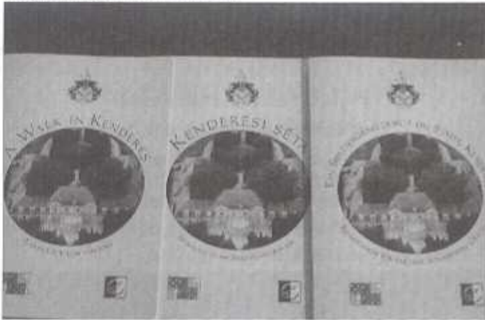
A többnyelvű kiadvány

A turisztikai célú honlapfejlesztés is ezen pályázat segítségével készült el, a honlapon megjelenési lehetőséget biztosítottunk helyi vállalkozóknak, megjelenítettük településünk vállalkozási lehetőségeire felkínált ingatlanait, Kenderesről átfogó turisztika kiadványt jelent meg 5100 példányban Kenderesi séták címmel magyar, angol és német nyelven.