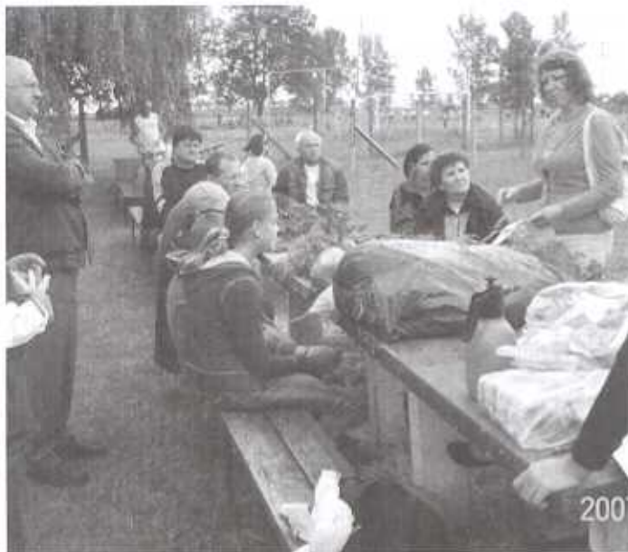
Az első kenderesi Parlagnágyfűmentesítési Nap résztvevői