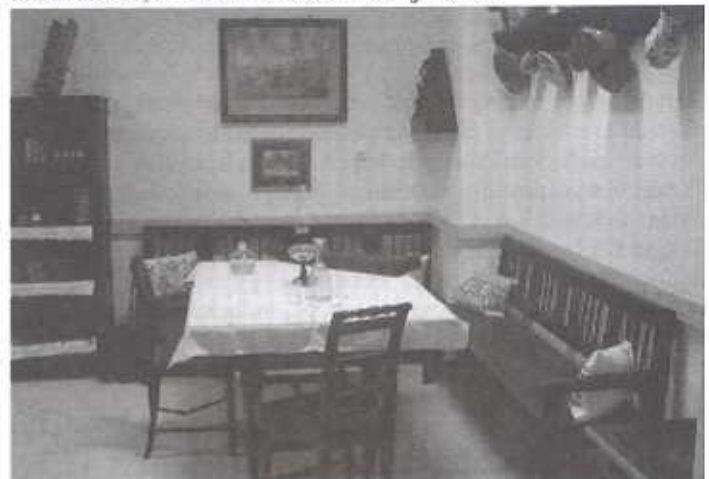
A Néprajzi Kiállítóterem