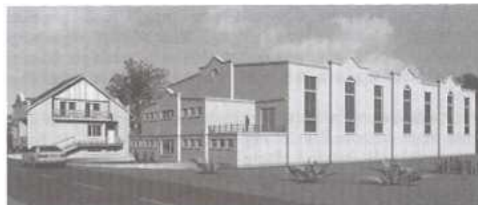
A tornaterem látványterve

Benyújtásra került 2008. év elején a Kenderesi Szakiskola Szakközépiskola és Kollégium tornaterem építési pályázata, amely az egész intézményre kiterjedő fűtőkorszerűsítéssel egészült ki.