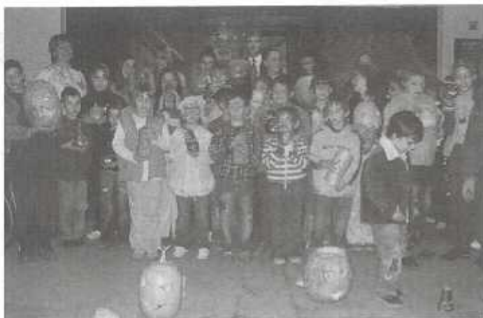
„Tök jó nap” utolsó pillanatai