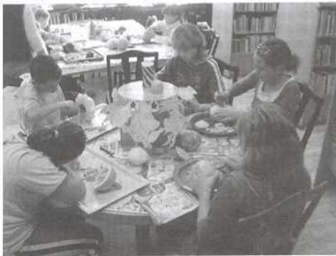
Készül a töklámpás