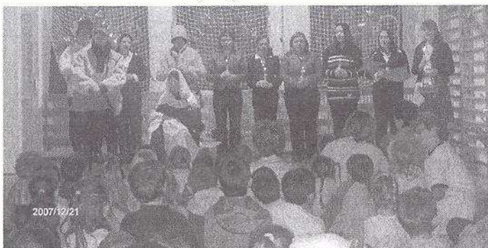
Megérkeztek a Szakiskola betlehemesei