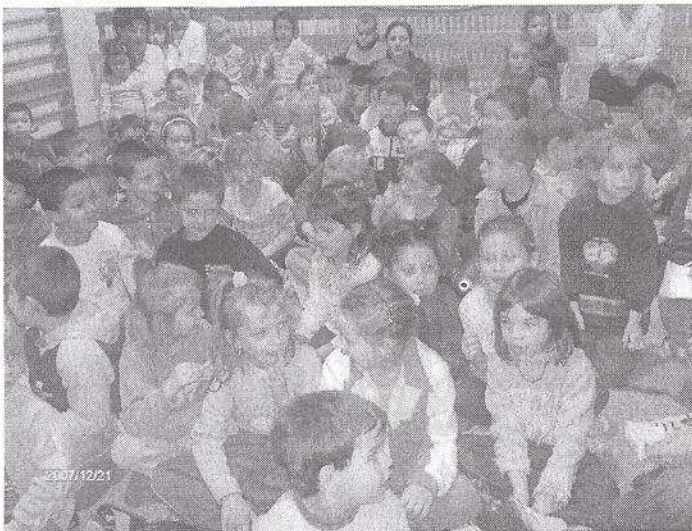
Karácsonyi izgalom az óvodában