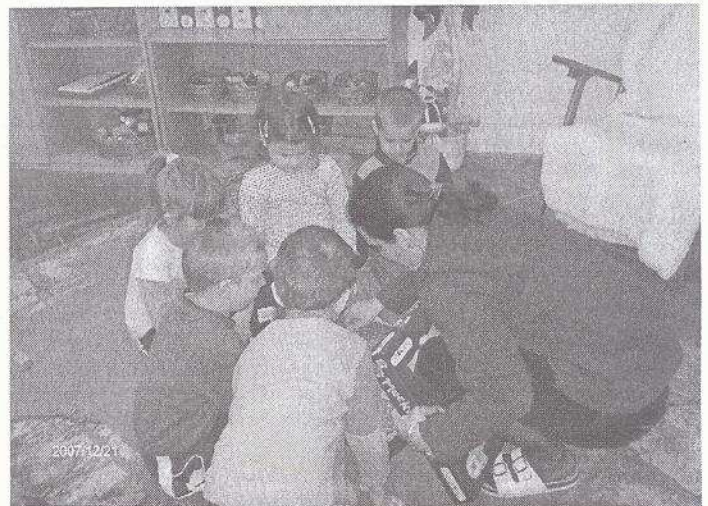
Mit hozott a Jézuska?