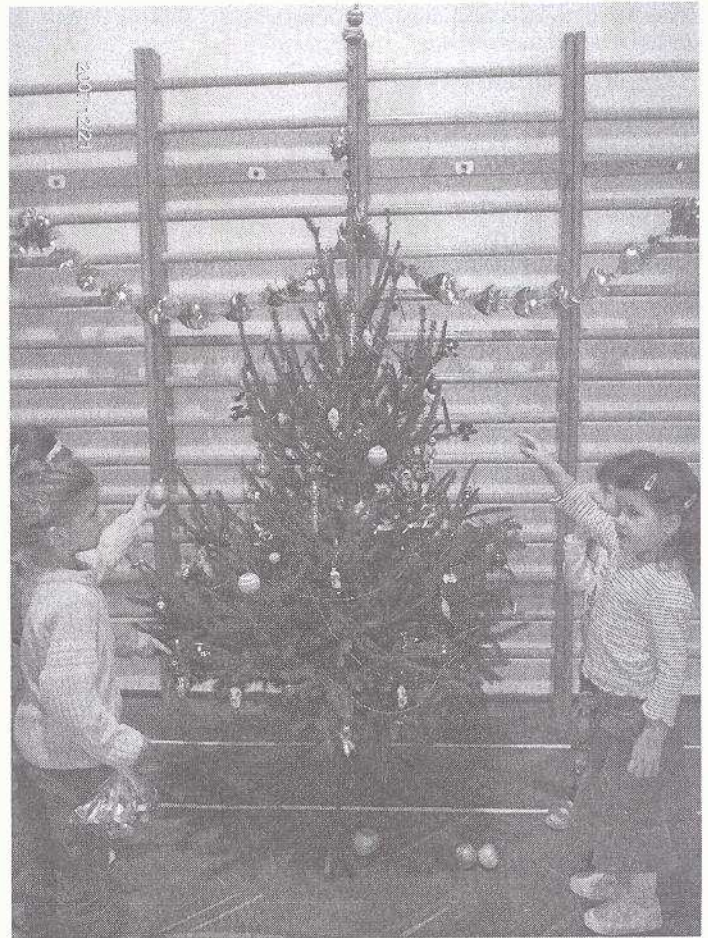
Ilyen magas ez a karácsonyfa!