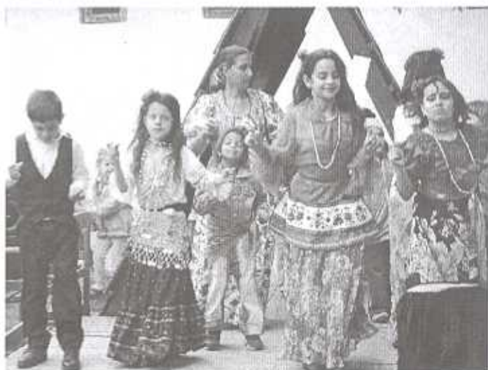
Tanuljuk a cigánytáncot