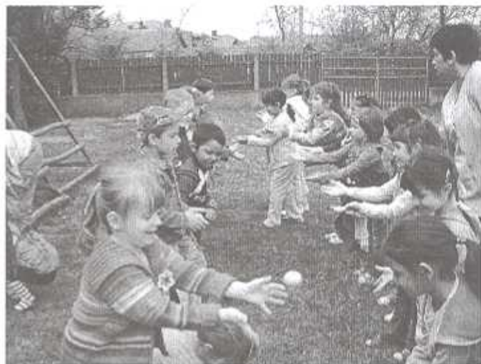
Kapd el a tojást!

A tojásdobáló versenyen az a pár nyert, akinek a legkésőbb tört össze a tojása.