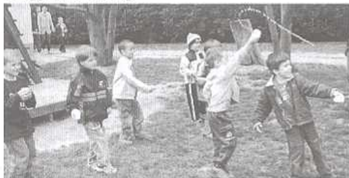
Fussatok lányok, mert eláztok!

Majd jött a locsolkodás, természetesen vízzel. Volt sikongatás, kacagás! A lányok a verses locsolást hímestojással és frissen sült bodaggal köszönték meg.