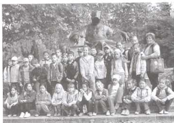
Kirándulás a Magyar Természettudományi Múzeumba