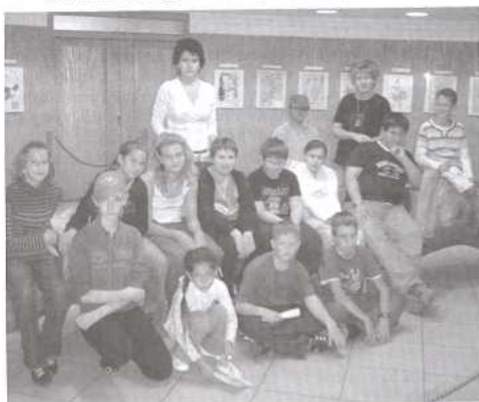
Kirándulás a Magyar Mezőgazdasági Múzeumba